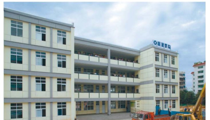
▲ 采用钢结构建成的四川广元市利州中学教学楼