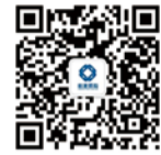
欢迎关注杭萧钢构微信

总部地址：杭州中河中路258号 瑞丰国际商务大厦3-7楼 电话：0571-87246788 传真：0571-87240484 0571-87247920 网址：http://www.hxss.com.cn 邮箱：jtxcb@hxss.com.cn 邮编：310003