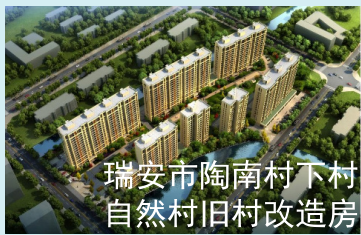
瑞安市陶南村下村 自然村旧村改造房

本报讯 5月28-29日，由中国建筑金属结构协会主办的2021年全国建筑钢结构行业大会在湖北·武汉隆重举行。杭萧钢构股份有限公司（以下简称“杭萧钢构”）承建的6个项目荣获中国建筑钢结构行业工程质量的最高荣誉奖项——中国钢结构金奖。同时，杭萧钢构获评“2020年度中国建筑钢结构行业五十强企业”、“2020年度建筑钢结构行业诚信企业”。